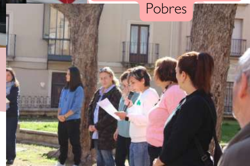
#Jornada Mundial de los Pobres