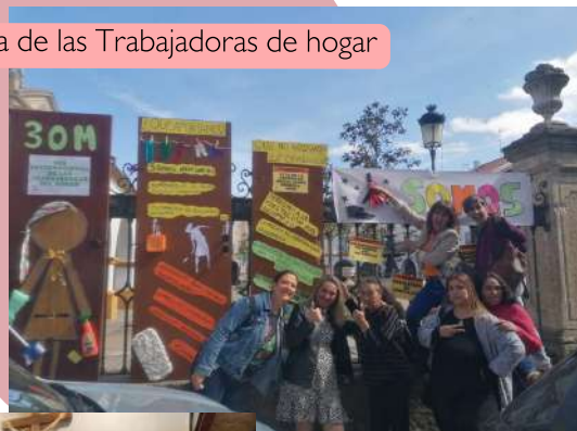
#Día de las Trabajadoras de hogar