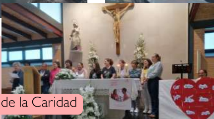
#Jornada Mundial de los Pobres