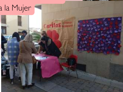
#Ruta urbana contra la violencia hacia la Mujer