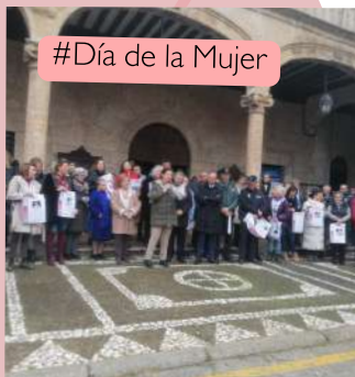
#Día de la Mujer