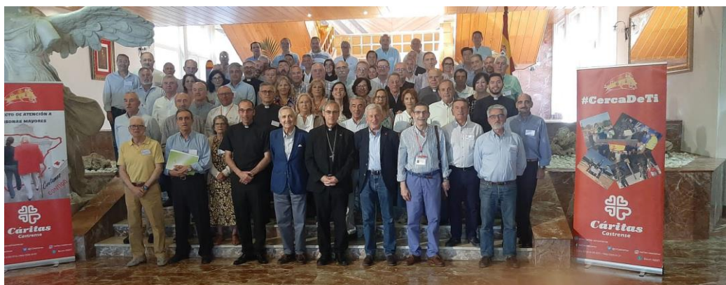
Foto de grupo de los asistentes a la convivencia anual de CC en 2023

En consecuencia, a final de 2023 se encuentran oficialmente constituidas 43 Cáritas Parroquiales que, excepto las tres mencionadas, se encuentran activas y mantienen un mayor o menor grado de operatividad según sus circunstancias particulares.