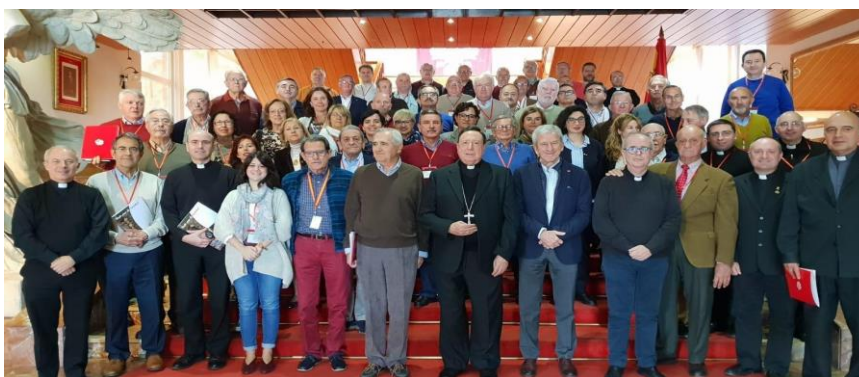
Foto de grupo de los asistentes a la convivencia anual de CC en 2018

Todo ello hizo que, en 2018, Caritas Castrense, además de sus Servicios Centrales (SSCC) en Madrid, tuviera 28 CPC distribuidas por toda España. La ayuda de Dios y la entrega de los voluntarios hizo posible el alumbramiento de Caritas Castrense como el órgano oficial del Arzobispado Castrense de España, erigida por su Arzobispo, que en su Iglesia particular la constituye para promover, coordinar y orientar la acción caritativa, social y la comunicación cristiana de bienes entre sus fieles, para cumplir el ministerio de la caridad que a él le corresponde.