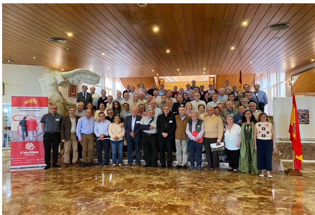
Foto de grupo de los asistentes a la convivencia anual de CC en 2024

En el año 2024, se incorpora la Caritas Parroquial Castrense de Alicante, que hace la numero 44 de las constituidas, de las cuales se encuentran activas en la actualidad 41 Cáritas Parroquiales en el conjunto de Cáritas Castrense.