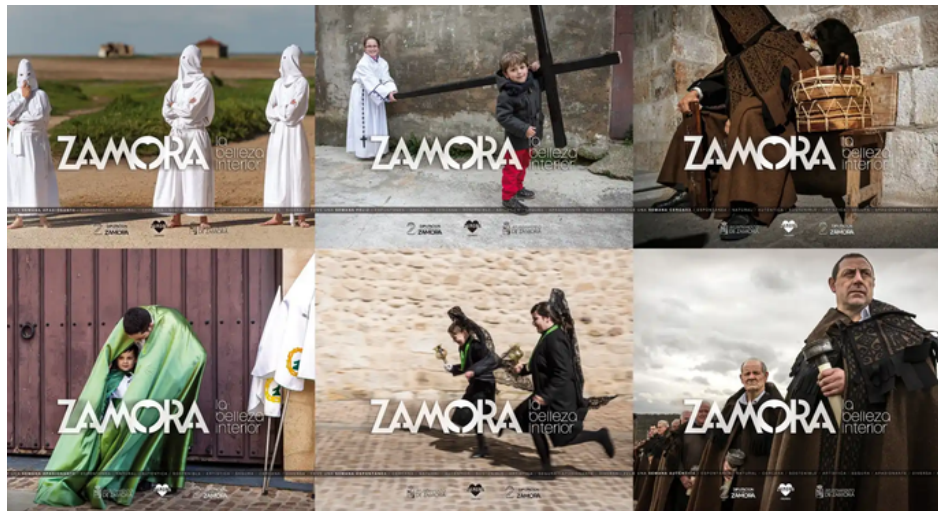
Campaña de publicidad elaborada por Martinde.

Zamoranos y visitantes devotos esperan, con paciencia y entre trompetas y tambores, el paso de cada uno de los grupos escultóricos. Son muchos los momentos clave de la Semana Santa de Zamora y se hace casi inimaginable poder transcribir las emociones tan intensas y tan diferentes que generan cada uno de ellos.