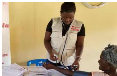
CÁRITAS CON HAITÍ