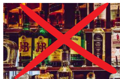
DESMONTADO MITOS SOBRE EL ALCOHOL