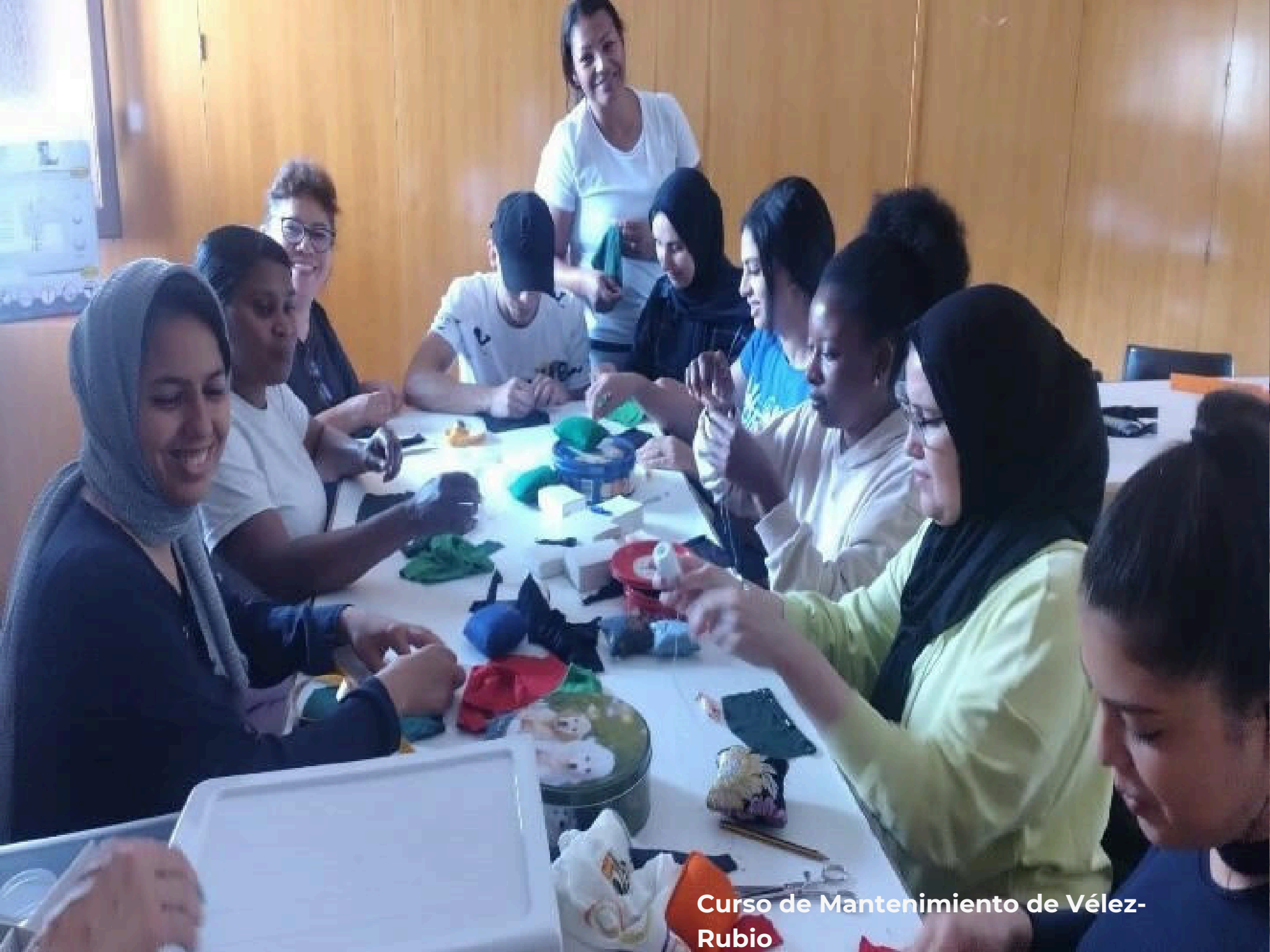
Curso de Mantenimiento de Vélez-Rubio